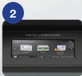
9.4cm TFT 컬러 LCD (한글 지원)