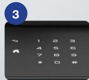
사용자 친화적인 제어판 (한글 지원)