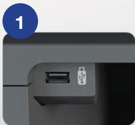
USB 다이렉트 인쇄